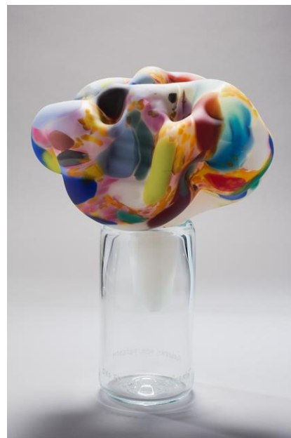
Marvin Lypovsky, Des fleurs pour la liberté.

76 rue du Général de Gaulle 59216 Sars-Poteries